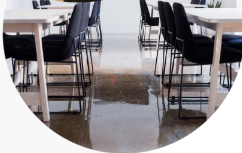
Darbo vietos kaina